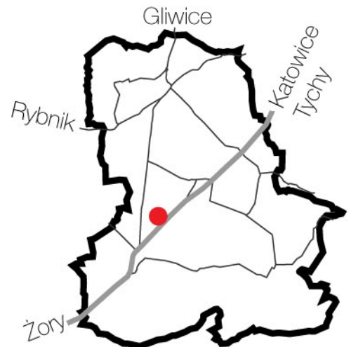
orientacja terenu inwestycyjnego w mieście

ZESTAWIENIE POWIERZCHNI W PRZYKŁADOWYM ZAGOSPODAROWANIU TERENU: pow. projektowanej zabudowy-17 625m 2