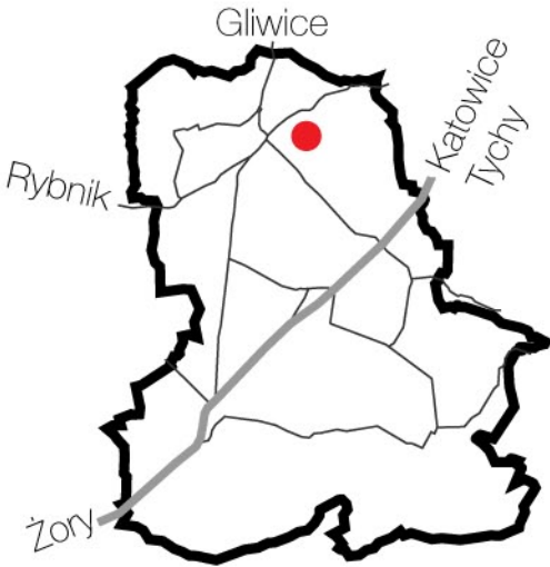
orientacja terenu inwestycyjnego w mieście

ZESTAWIENIE POWIERZCHNI W PRZYKŁADOWYM ZAGOSPODAROWANIU TERENU: pow. projektowanej zabudowy-2 650m2